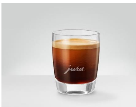
Dobbelt Espresso Dobbelt nydelse 2 x 45 ml espresso