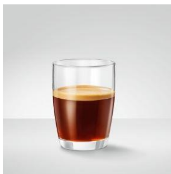
Café Barista / Americano 45 ml espresso tilsat varmt vand