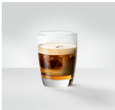
Cold Brew Cafè Latte 100 ml kaffe med mælk, mælkeskum og brygget over et par isterninger. Tilsæt gerne sirup.