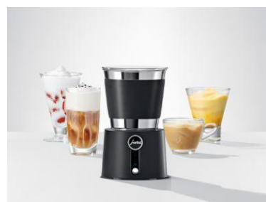
Flere lækre opskrifter (klik på billedet)