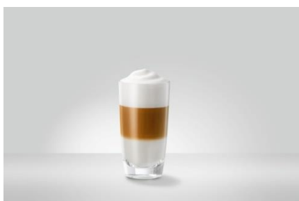
Latte Macchiato 45 ml Espresso med varm mælk og mælkeskum