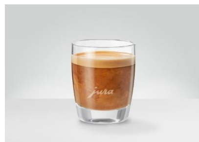
Cafè Latte Den italienske variant af kaffe med mælk 100 ml kaffe med mælk og mælkeskum