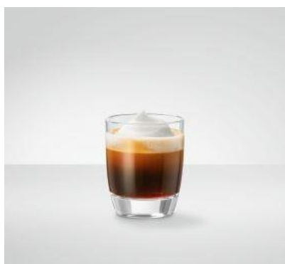
Espresso Macchiato Den absolutte klassiker fra Italien 40 ml espresso med mælkeskum