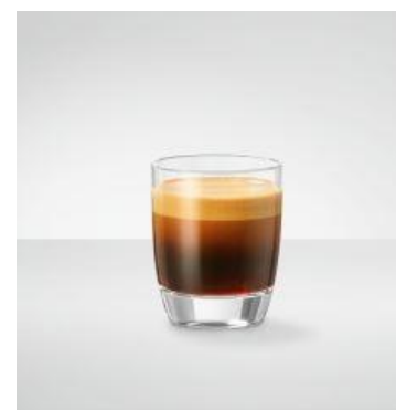
Espresso Den absolutte klassiker 45 ml espresso