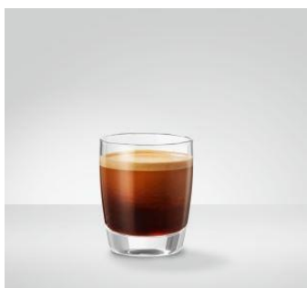
Cafè Creme Den klassiske fra Schweiz 100 ml kaffe tilsat mælk/fløde