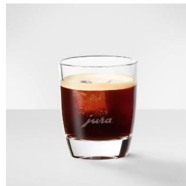
Cold Brew Espresso 45 ml espresso, brygget over et par isterninger. Tilsæt gerne sirup.