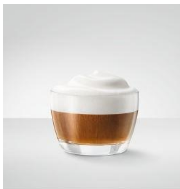
Cappucino En klassisk italiensk opskrift 50 ml espresso tilsat mælk og mælkeskum